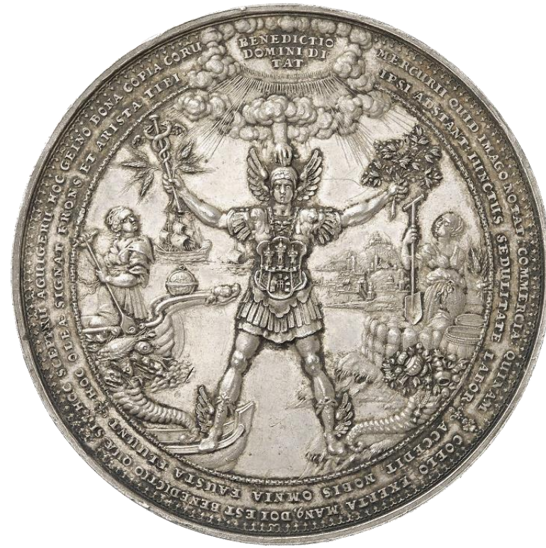
[G3, S.329] Leopold I. bestätigte 1660 das von Friedrich III. Hamburg 1482 verliehene Privilegium, ferner das 1628 von Ferdinand II. gewährte Elbprivilegium.